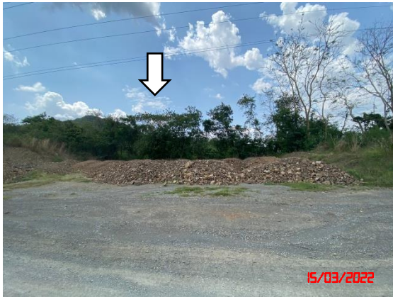
รูปที่ 2-1 แนวเขตพื้นที่ไม่ทำเหมืองจากขอบประทานบัตร