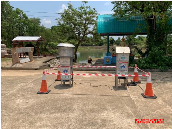
บ้านนครนายก