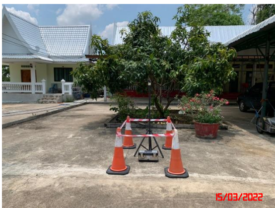
บ้านนครนายก