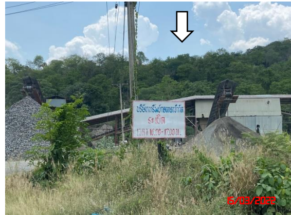
รูปที่ 2-2 ป้ายแสดงเขตพื้นที่การทำเหมือง