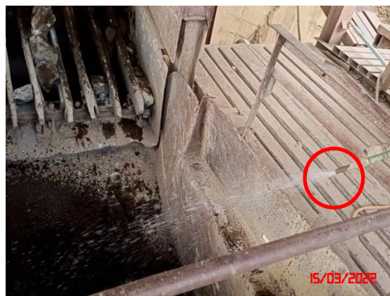
ระบบเปรี๊ยน้ำบริเวณแหล่งกำเนิดฝุ่นละออง