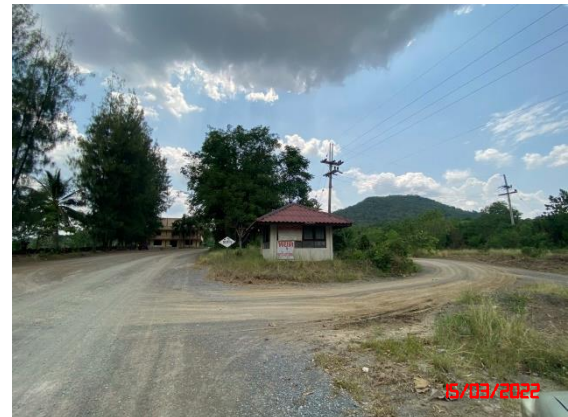
รูปที่ 2-14 จุดชั่งน้ำหนักบรรทุก