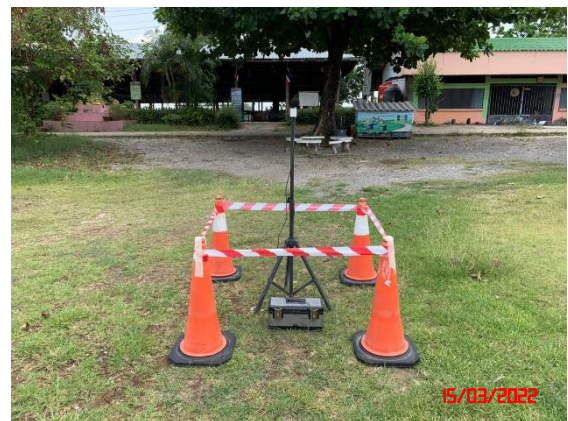
บ้านแก่งหินปูน