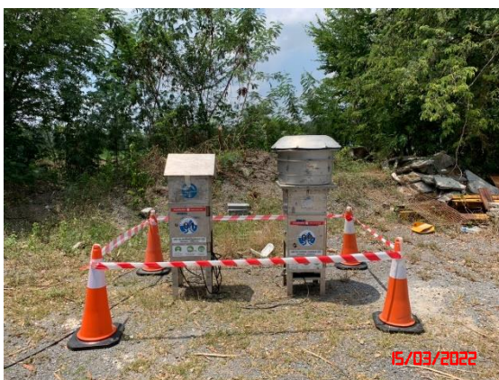
สำนักงานโรงโม่หินของโครงการ