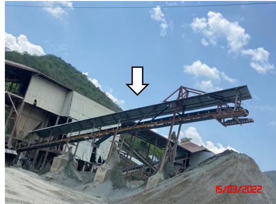
หลังคาปิดคลุมสายพานลำเลียง