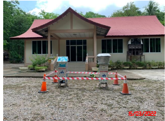
บ้านเตาถ่าน