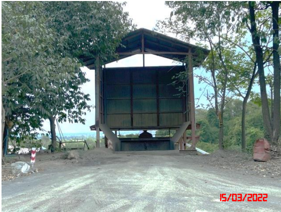
อาคารปิดคลุมยังรับหินใหญ่