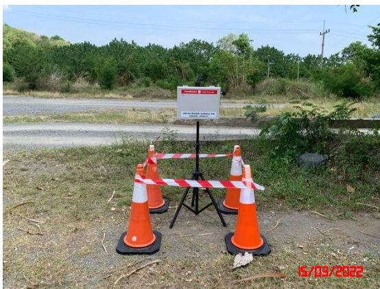
สำนักงานโรงโม่หินของโครงการ