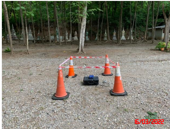
สำนักสงฆ์ถ้ำแก้วกายสิทธิ์