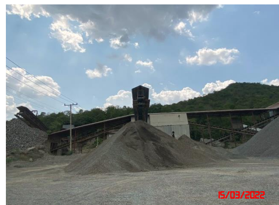
อาคารปิดคลุมโรงโม่หิน