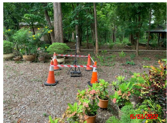
บ้านเตาถ่าน