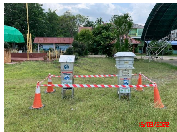
บ้านแก่งหินปูน