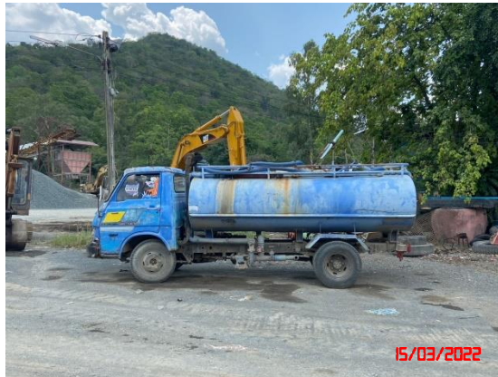
รูปที่ 2-13 เส้นทางขนส่งแร่