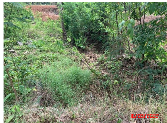
น้ำห้วยแก่งหินปูน