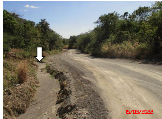
รูปที่ 2-7 คันทำนบดิน